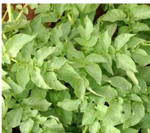
Minecto Pro 0,75